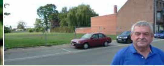
Negatief advies voor site Develter (p. 3)