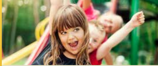
Subsidies dankzij N-VA-ministers (p. 2)