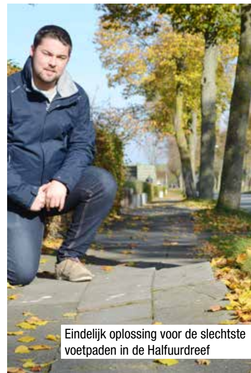
Eindelijk oplossing voor de slechtste voetpaden in de Halfuurdreef